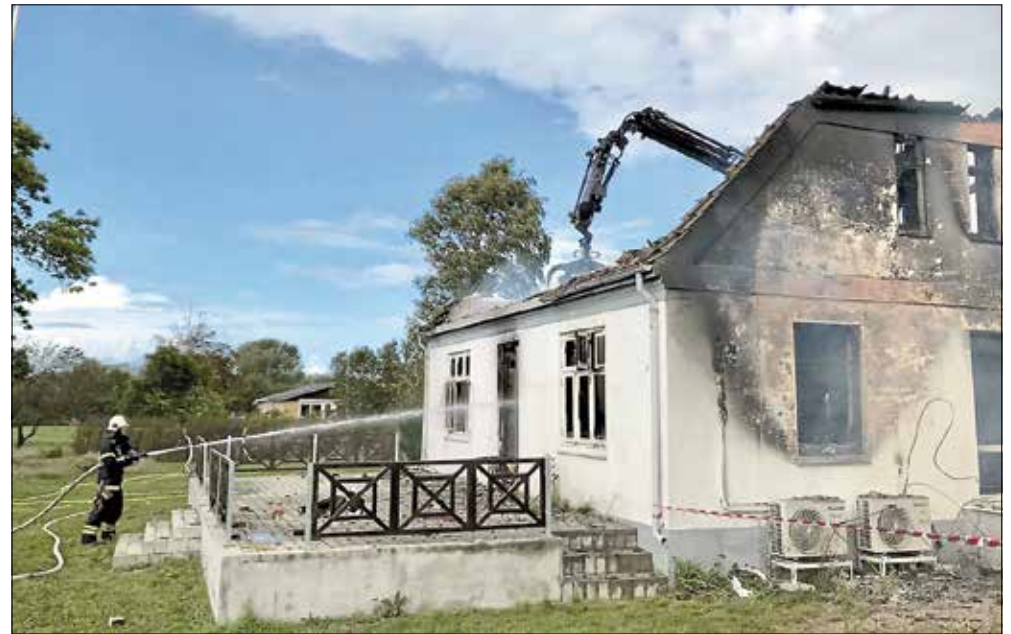
En brandmand sprøjter vand på, når gravemaskinen løfter brændende dele fra husets tag og første sal op fra stueetagen.

- Det er planen, at vi samles minimum en gang om ugen, og det skal være hver uge. Det vil jeg arbejde benhardt på, afslutter Peter Raagaard.